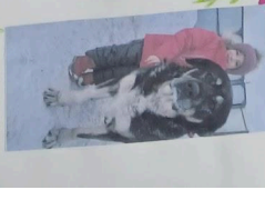
Eno jidiš becvat! Pivca! Dva jidišica i otkrivanje savosa nastave i življenja. Kletna Nij u vavati!