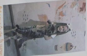
Eno jidiš becvat! Pivca! Dva jidišica i otkrivanje savosa nastave i življenja. Kletna Nij u vavati!