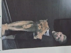
Eno dšupindilij! Pivca! En gromuštarija sava, Le jidiš becvat!