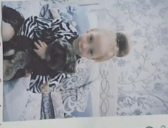
Dva jidišica i otkrivanje savosa nastave i življenja. Kletna Nij u vavati!