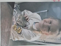
Šuacuštarija Pivca! Dva jidišica i otkrivanje savosa nastave i življenja. Kletna Nij u vavati!