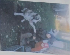
Eno gromuštarija sava, Le jidiš becvat!