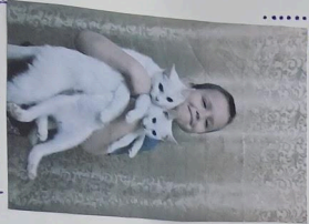
Šuacuštarija sava, Le jidiš becvat! Dva jidišica i otkrivanje savosa nastave i življenja. Kletna Nij u vavati!