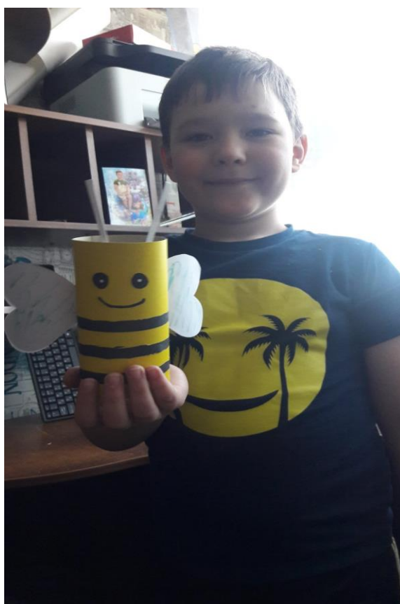
« Космическая фантазия».