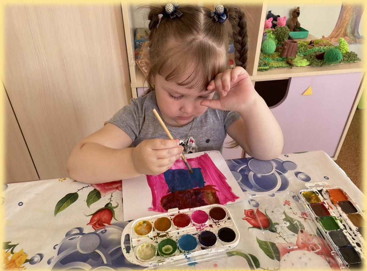
Рисование по замыслу