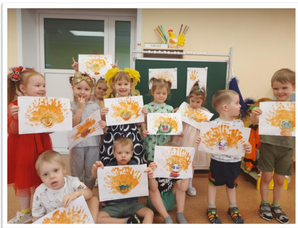
НОД рисование. Тема: «Веселый клоун».