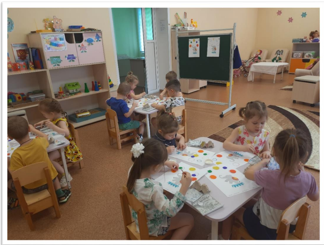
НОД аппликация. Тема «Слон – жонглер»

Прошла неделя «День смеха, цирк, театр», в группе Пчелки!