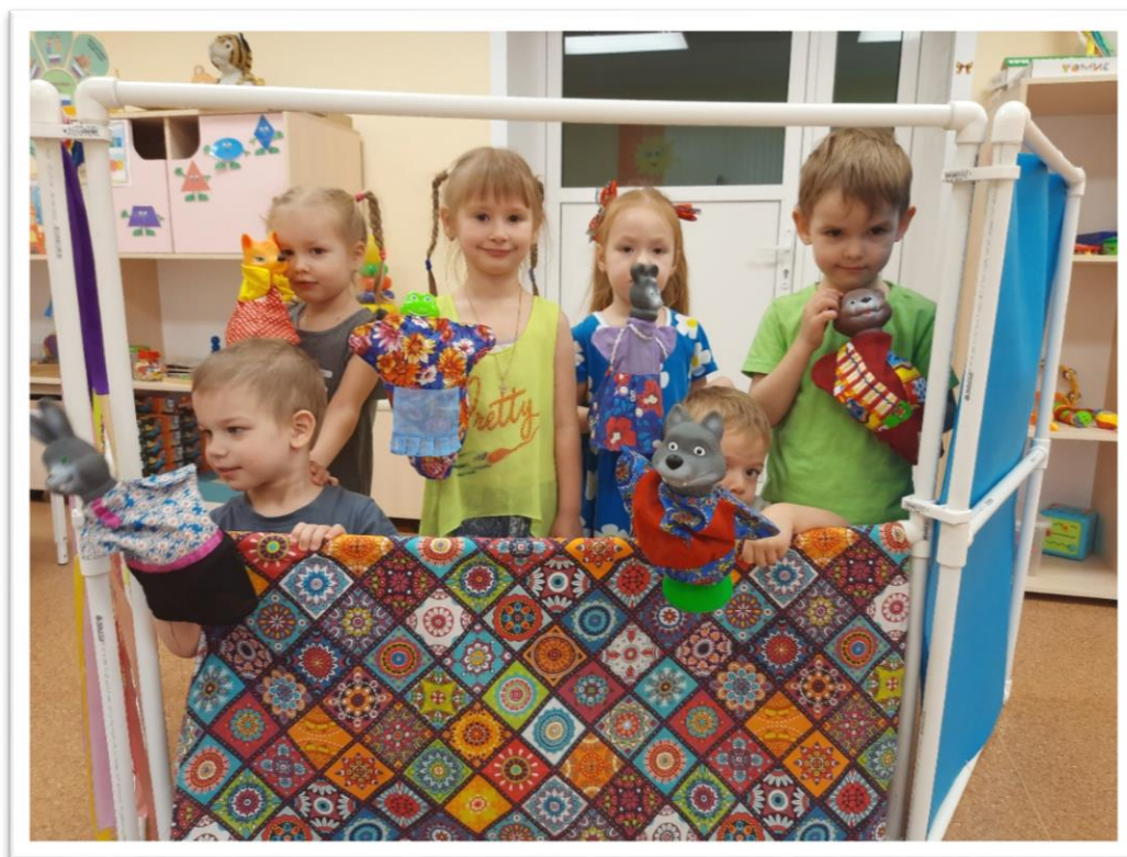
Итоговое мероприятие «Сказка «Теремок».