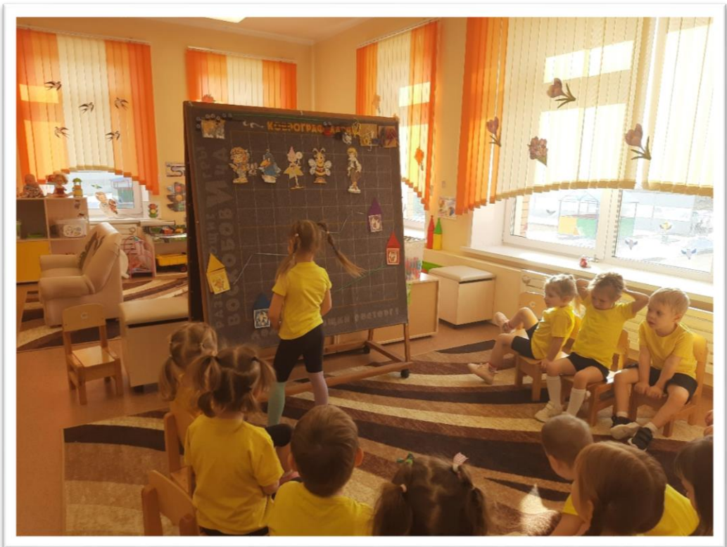
НОД ФЭМП. Тема: «Поможем жителям фиолетового леса».