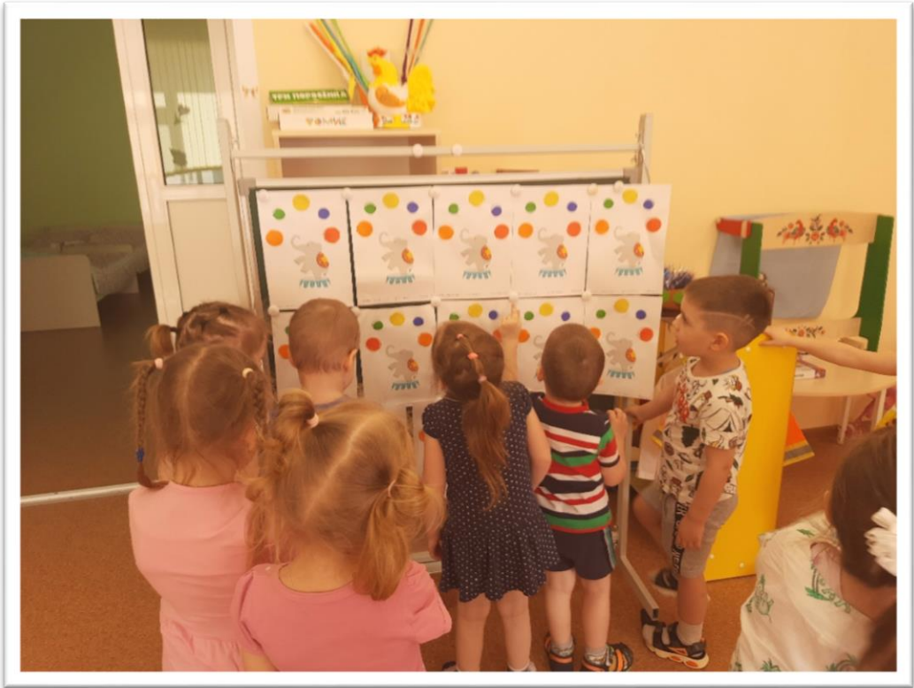
Вот какие яркие и веселые у нас слоники