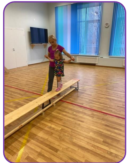
Ходили на физкультуру в спортивный зал.