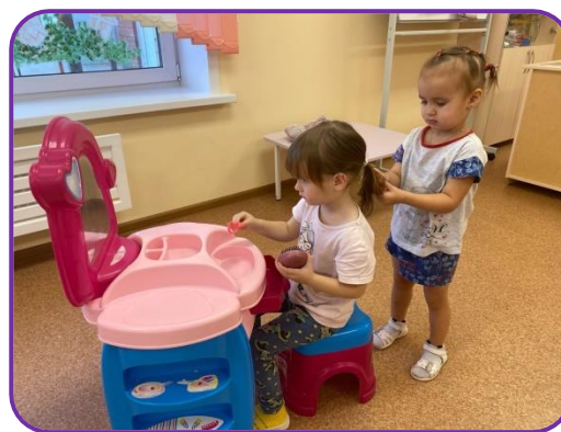
С девочками играли в сюжетно-ролевую игру «Парикмахерская». Расчесывали друг друга и делали хвостики.

Всю неделю мы с ребятами проводили беседы о нашем поселке – Березовка. Запоминали название поселка и свои домашние адреса. Познакомили деток с Российским флагом, рассказали, что означают его цвета.