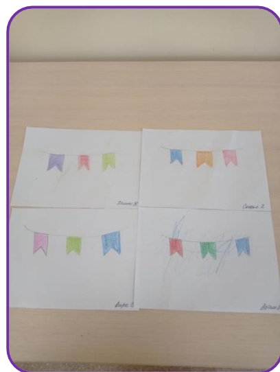
Рисование: «Красивые флажки на ниточке»