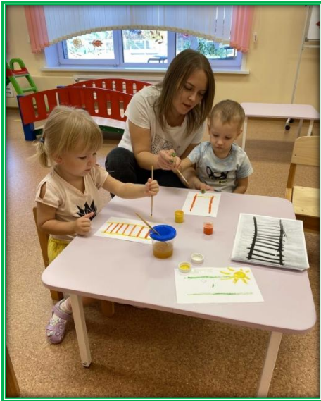
Рисовали «красивые лесенки»