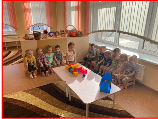
ФЭМП «Много - мало»