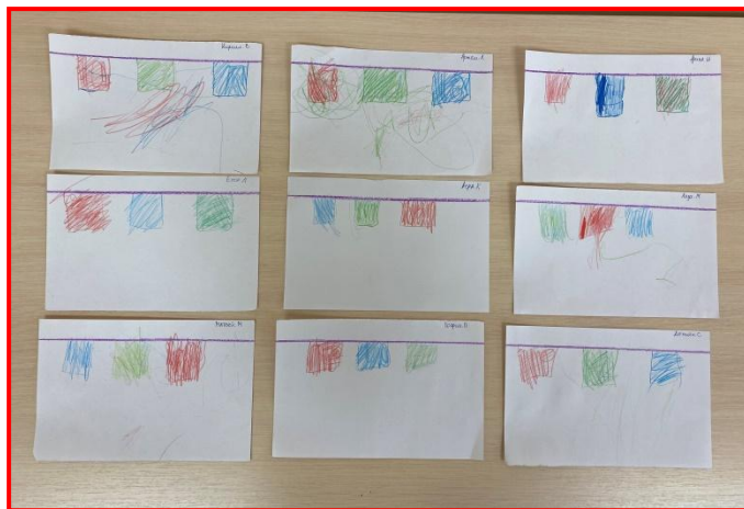
Рисование «Разноцветные платочки сушатся»