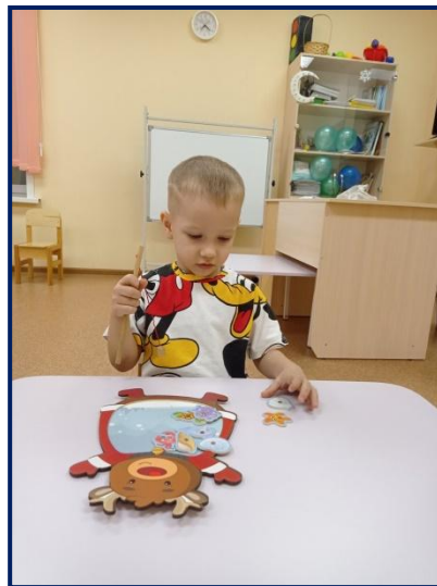
Ознакомление с окружающим миром