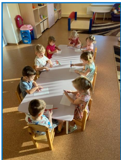
Рисование «Рисование по замыслу»