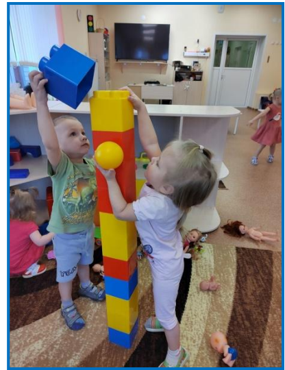
Самостоятельная игровая деятельность детей