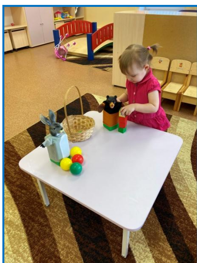
ФЭМП «Много – много»