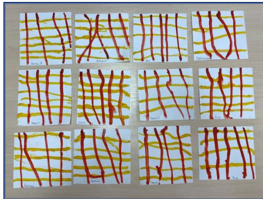
Рисование – «Платочек»