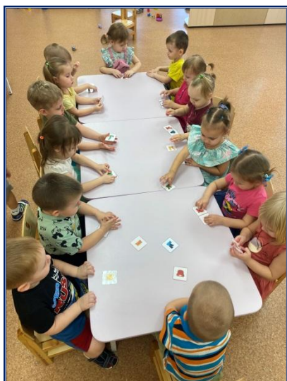
Дидактическая игра «Найди пару»