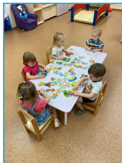
Самостоятельная игровая деятельность детей(настольные игры, пазлы)