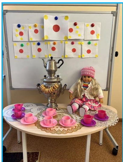
Аппликация «Красивая салфеточка»

На итоговом мероприятии у нас было создание фотоальбома «Край ты мой родимый – нет тебя красивей!»