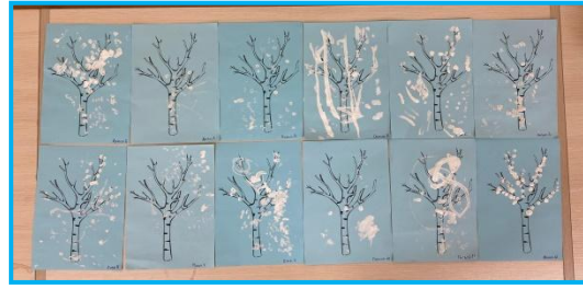
Рисование «Деревья в снегу»