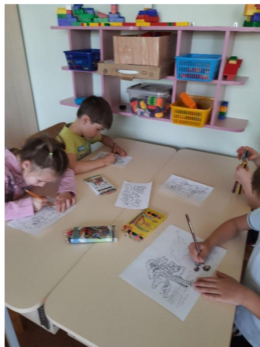
Помогаем Лесовичку вернуть краски Осени.